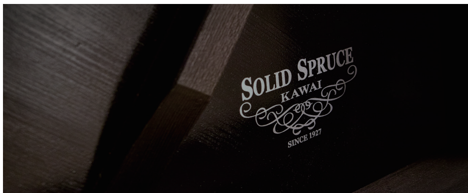
TAVOLA ARMONICA IN ABETE MASSICCIO

Collocato tra altri componenti di arredo, il pianoforte è spesso considerato il pezzo più importante. Le parti colore silver, la tavola armonica e il telaio neri, rendono il ND-21 uno strumento dall'estetica sofisticata che da un tocco in più all'ambiente dove è collocato.